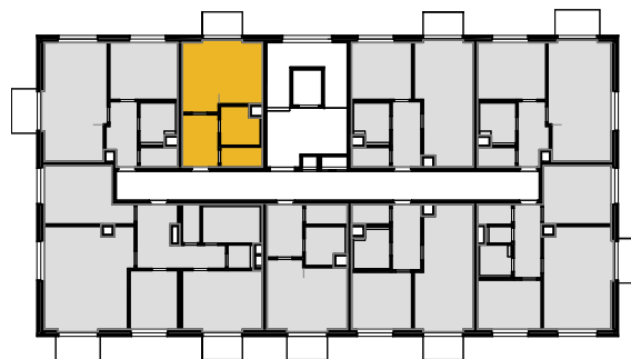
schéma polohy bytu na patře 1:500